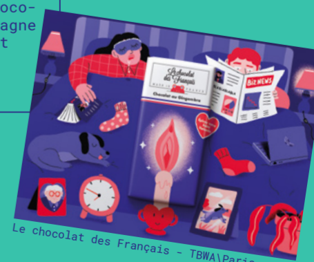
Le chocolat des Français - TBWA Paris

AU MILIEU DU VISUEL, LA TABLETTE LES APPELLE À ÉPICER LEUR SOIRÉE GRÂCE À DES ILLUSIONS D'OPTIQUE CROISANT OBJETS DU QUOTIDIEN ET AMBIGÜITÉ SEXUELLE. CHAUD CACAO! C'EST DRÔLE, TRÈS ESTHÉTIQUE ET ÇA MÉRITE BIEN SON SILVER LION À CANNES DANS LA CATÉGORIE DESIGN.