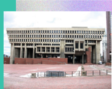
Kallmann McKinnell & Knowles Boston 1969

UN PEU D'HISTOIRE : le brutalisme à la base est un mouvement architectural en vogue dans les années 50 à 70. Des lignes anguleuses, des formes massives, et du béton brut comme matériau principal. À la fin de la Seconde Guerre mondiale, ce courant se démocratise rapidement car il donne vie à des constructions résistantes et peu coûteuses. Il finit par être mis de côté pour l'austérité de l'image qu'il renvoie et pour ses lignes pauvres qu'on associe aux régimes totalitaires.