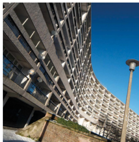
Alison & Hutchison & Partners / Edimbourg 1965

Le brutalisme n'a rien à cacher, il se fiche des codes de la beauté, des standards. Il avoue tout, sans chichi, brutal et lapidaire.