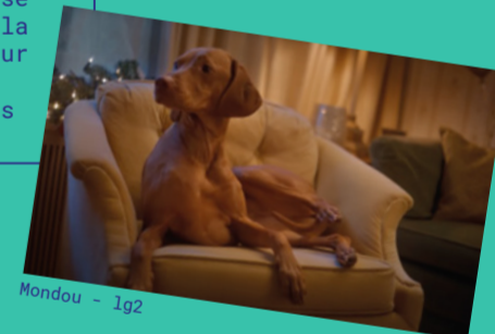
Mondou - Iq2

UNE TRÈS BELLE MANIÈRE POUR LA MARQUE DE DÉBUTER 2022 SUR LE TON DE L'HUMOUR MALGRÉ LA PANDÉMIE. LA PUB AFFICHE CLAIREMENT LE PLAISIR QUE L'ON A TOUS EU À SE RETROUVER POUR LES FÊTES. COMME QUOI, MALGRÉ LA CRISE ET LES GESTES BARRIÈRES BOULEVER-SANT NOTRE QUOTIDIEN, CERTAINES (SALES) HABITUDES SONT TOUJOURS INTACTES.