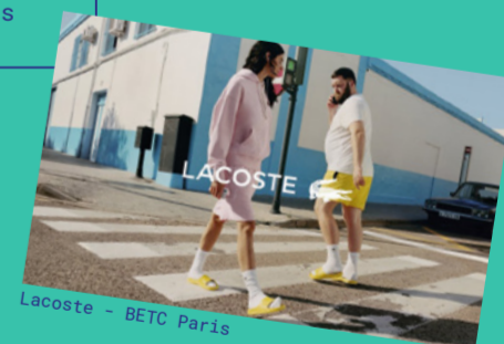
Lacoste - BETC Paris

LA MARQUE PROUVE UNE NOUVELLE FOIS QU'ELLE TRANSCENDE LE TEMPS, LES STYLES ET LES GENRES. ET C'EST TELLEMENT JUSTE QUE LA CAMPAGNE HAUTE EN COULEURS SE PASSE DE CLAIM!