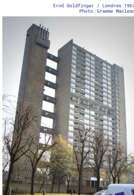
Ernő Goldfinger / Londres 1967